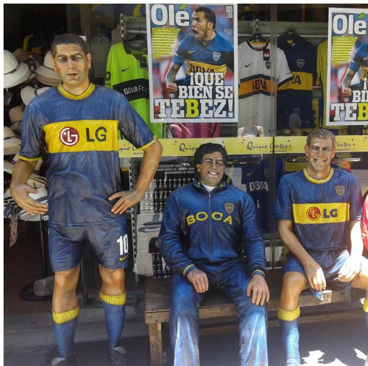
Frente al estadio, estatuas de los jugadores más importantes de los últimos tiempos de Boca Juniors: Juan Román Riquelme, Diego Armando Maradona y Martin Palermo.