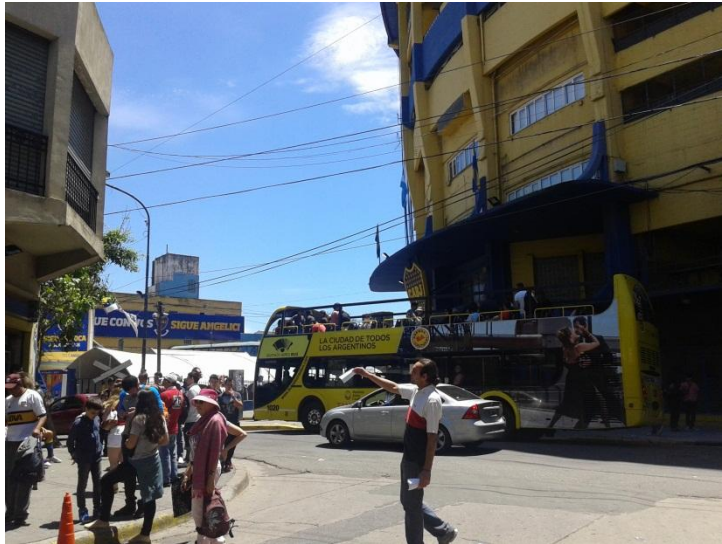
Bus turístico de la Ciudad de Buenos Aires.