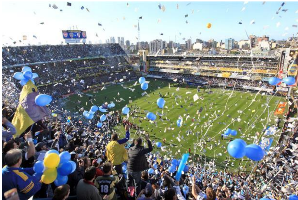
La Bombonera en medio del ingreso de sus jugadores.