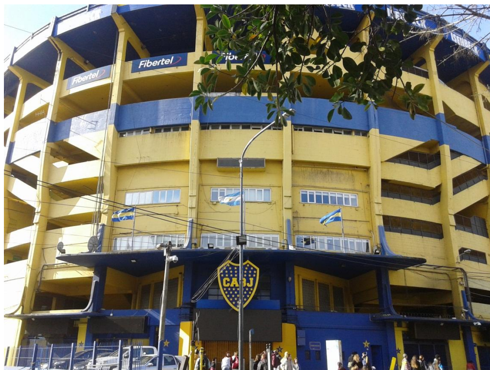
Estadio Alberto J Armando, más conocido como “La Bombonera”.