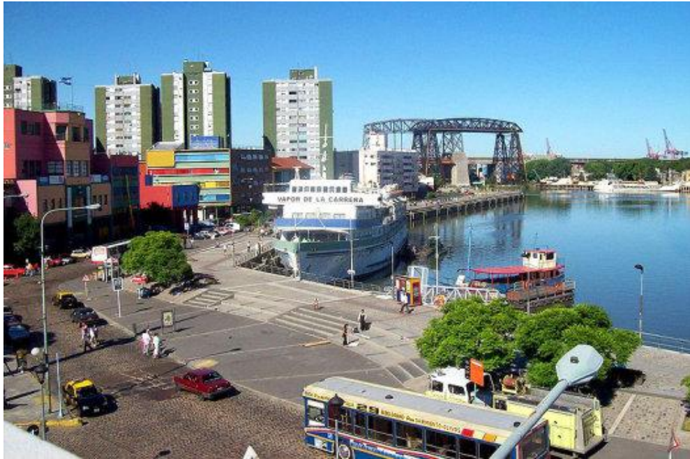
Vista aérea del Riachuelo