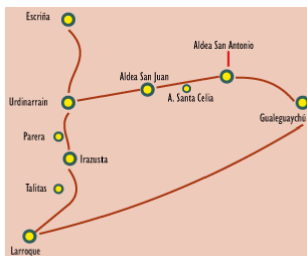
Mapa del circuito “Pueblos del sur entrerriano”

En la actualidad se encuentra información turística sobre Irazusta en Internet en algunas páginas de Turismo Rural y en la página oficial de Turismo del departamento de Gualeguaychú formando parte del circuito “Pueblos del sur entrerriano” en donde se describe la oferta basada en la tranquilidad, seguridad, el reencuentro con la naturaleza, la cordialidad y hospitalidad de su gente. También se encuentra el teléfono e e-mail para contactarse. ( www.antiquanatura.com.ar , www.gualeguaychuturismo.com , www.urdi.com.ar )