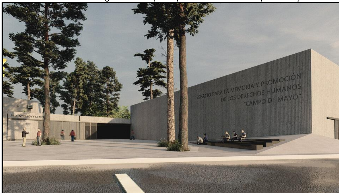
Foto 2: render Placa de Ingreso del Espacio para la Memoria Campo de Mayo.